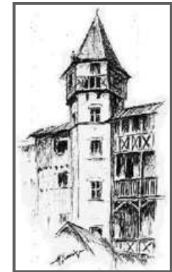
Tour d'Alverge dessin Marcel Grande